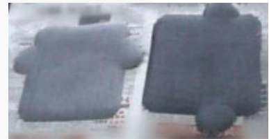
Before 過膠前 | After 過膠後