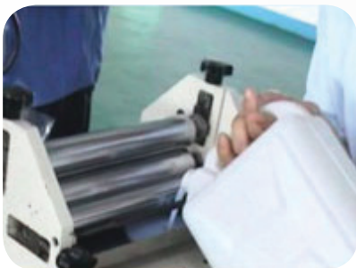
Load water-based adhesive 倒入水性膠